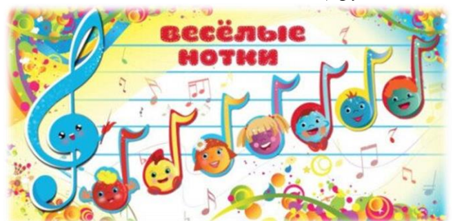
Кристина Аркадьевна (Группа №13)

"Песенки-распевки на музыкальных занятиях"